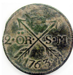
2 Öre SM 1763