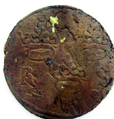
1/4 Öre 1638