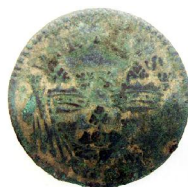
1 Öre KM 1720