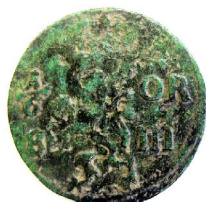
1/6 Öre SM 1666