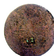
1 Öre KM 1726