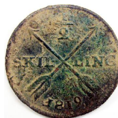
1/2 Skilling 1819