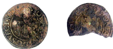
JOHAN III 1/2 Öre 1577 resp. 1578.