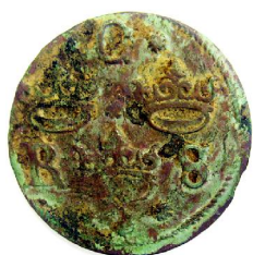
1/4 Öre 1636