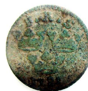
1 Öre KM 1721