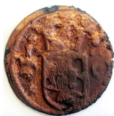
1/4 Öre 1634-42?