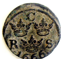
1/6 Öre SM 1666