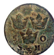
5 Öre SM 1690