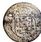
2 Skilling 1677, DK