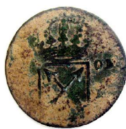
1 Öre KM 1719