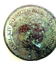
2/3 Sk Banco 1842