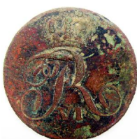
1 Skilling 1809, N