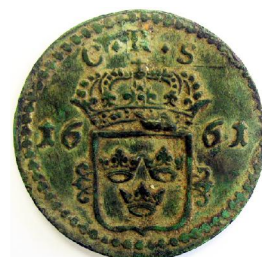
1 Öre KM 1661