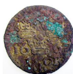
1 Öre 1667