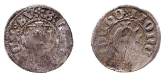
GUSTAV VASA 1 Örtug U.år (1535-1540).