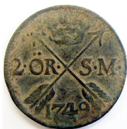
2 Öre SM 1749