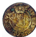
1 Öre 1649, Reval