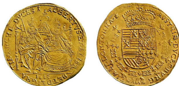
SPANSKA NEDERLÄNDERNA (Belgien). Albert av Österrike & Isabella av Spanien. Dubbel Souverain d'or 1613 slagen i staden Tournai. Guld Ø 38 mm, 11,06 gram.